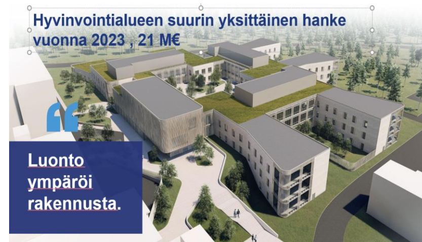
KAUPIN YLIOPISTOLLINEN SOSIAALI JA TERVEYSKESKUS